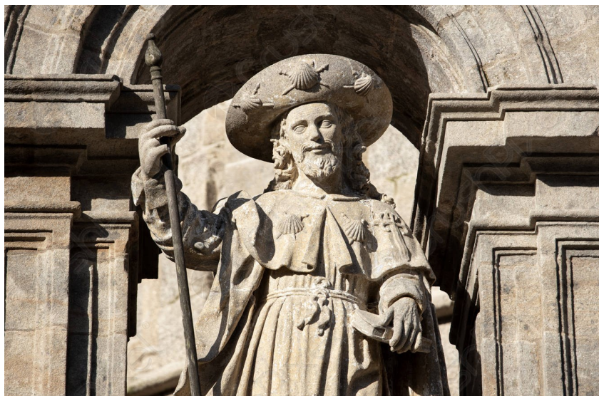
Statue de Saint Jacques le Majeur, détail de la basilique de Santiago de Compostella

L'histoire du Chemin débute à Jérusalem en 42 ou 44, après le martyre de Saint Jacques, apôtre du Christ. Deux de ses disciples dérobent son corps et le chargent sur une barque, qui poussée par les vents et les courants, s'échoue sur les côtes de Galice. La reine de ce lieu aurait alors fait construire un palais pour abriter le corps de celui qui deviendra Saint Jacques le Majeur.