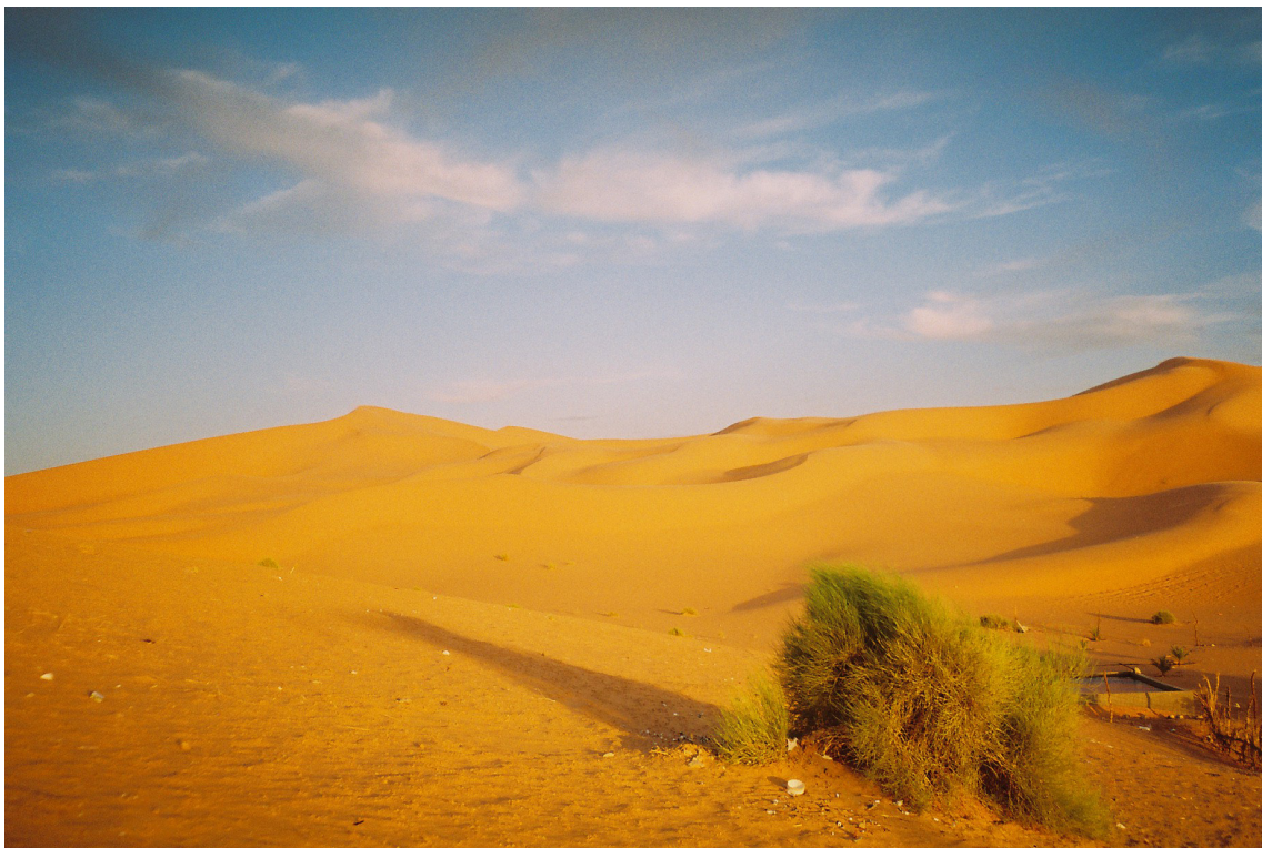
Yvan Stern (Petit Frère de Jésus)