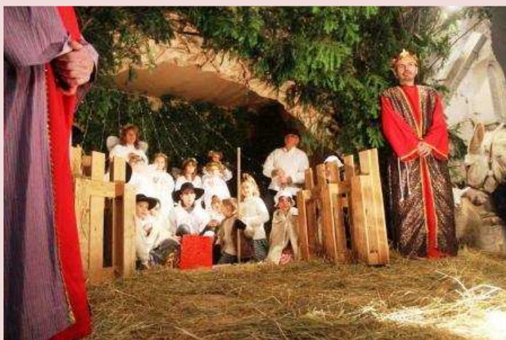
Crèche vivante à St Michel de Volangis

Extrait de la fin du conte de Noël remis sur une carte postale et distribué à l'assemblée le 24 Décembre