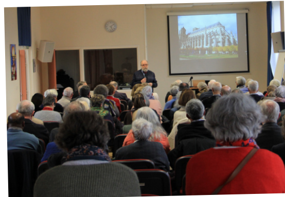
L'exposition « La Cathédrale au fil des âges » a été inaugurée le 12 mars.