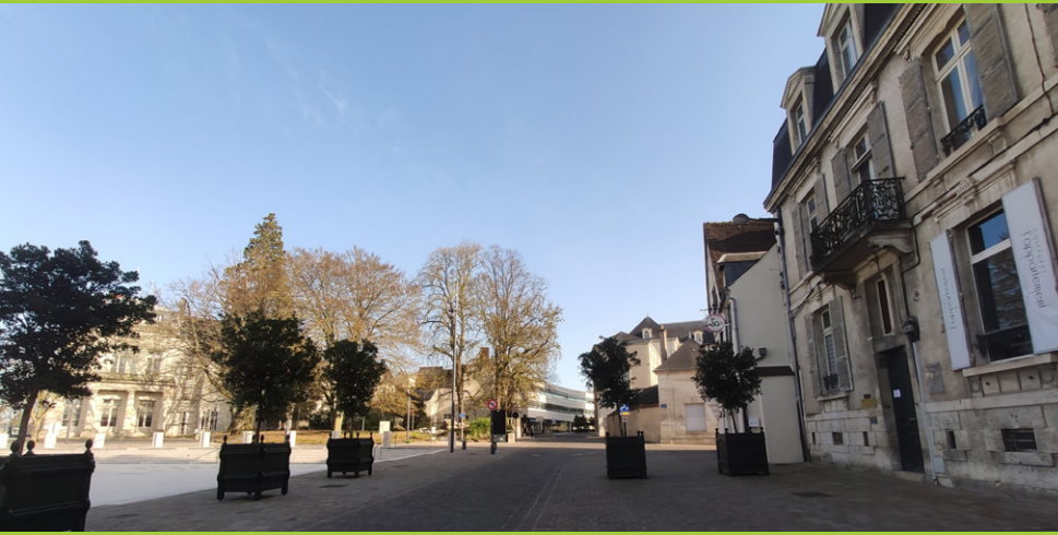
Bourges, durant le confinement

Il y a quelques jours, je vous ai invités à réfléchir en communauté à ce temps que nous venons de traverser et à partager les appels du Seigneur qui en surgiront. Les différents conseils paroissiaux et diocésains devront reprendre vos contributions pour définir les axes pastoraux à mettre en œuvre les mois prochains ainsi que ceux que nous pourrions réaliser au service du bien commun.