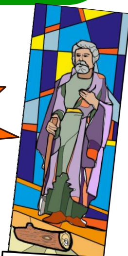
Fête de St Joseph - Temps de prière - Diocèse

Nous pouvons ainsi exprimer notre prière à Dieu notre Père : une louange, une action de grâce, une demande de pardon, ... Il ne faut pas hésiter à mettre en œuvre tout son corps ... Le chant peut rapprocher de Dieu, il permet d'unir des gens malgré leurs différences. Il transmet aussi la foi. Nous ne prêtons pas toujours attention aux paroles des chants religieux que nous entendons, pourtant elles irradient la vérité de l'Évangile. Le chant élève les âmes.