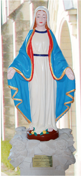
Notre Dame de l'Autre Chemin