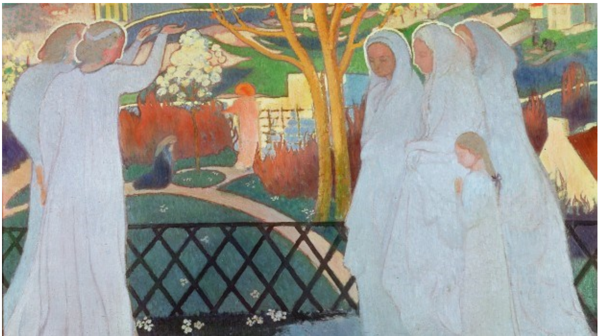
Les Saintes Femmes au Tombeau (1894), par Maurice Denis, Musée Maurice Denis.