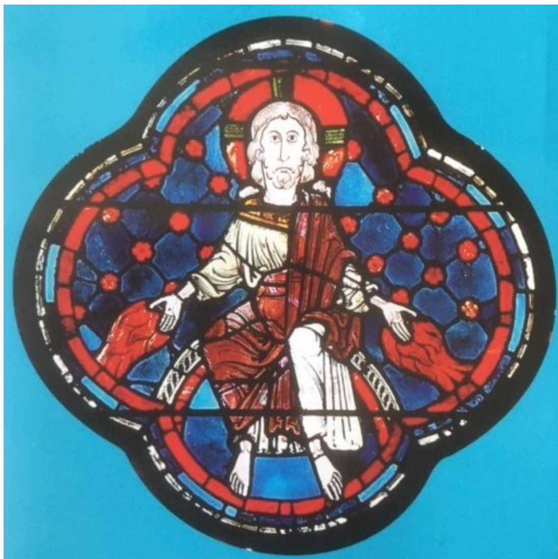
Christ du vitrail de l'Apocalypse du XIII e s - Cathédrale de Bourges