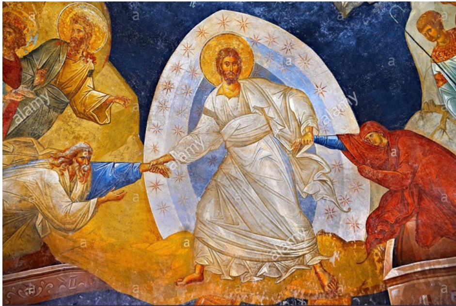
Fresque de l'Anastasis parecclesion

Réjouissons-nous , car il est ressuscité le Christ, la joie éternelle.