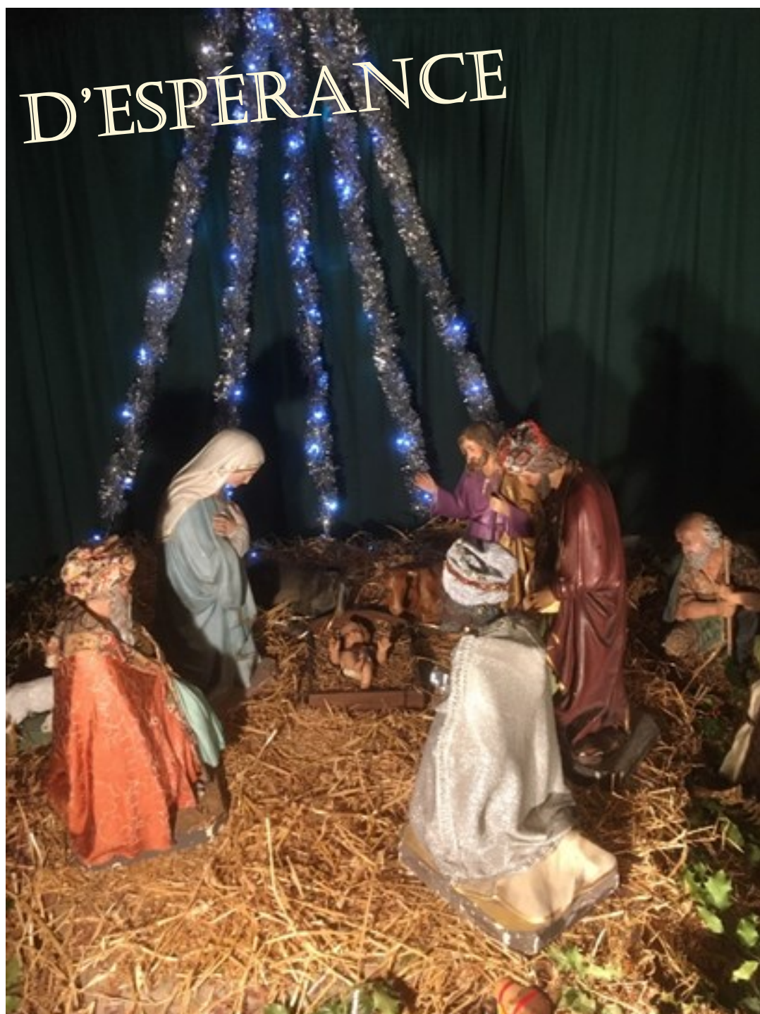
Crèche de l'église Saint Pierre le Guillard