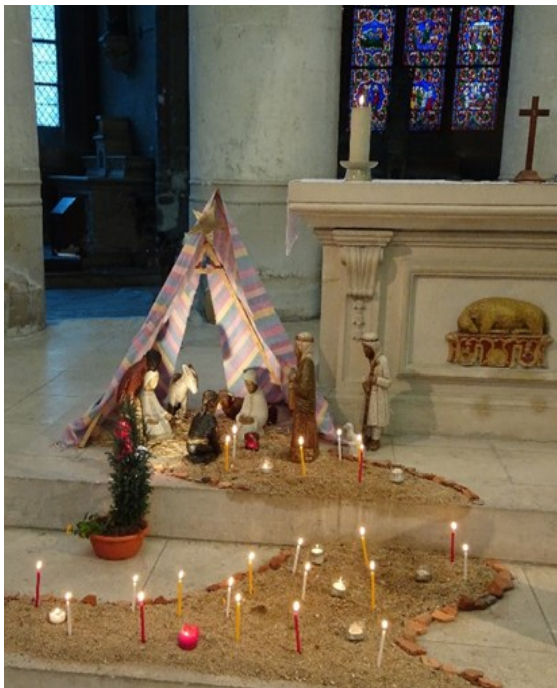
Crèche de l'église Saint Bonnet