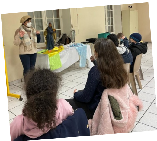
Atelier « Seigneur, apprends-nous à prier »