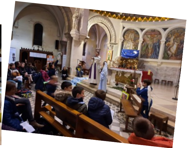
Célébration de l'Avent du caté pour tous les groupes de la paroisse