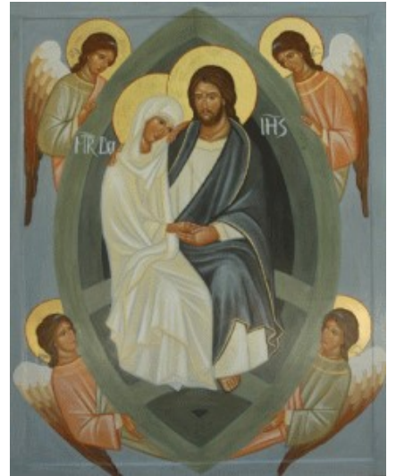
Icône de l'Assomption, Pérouse

Ô Marie, Mère de l'Amour Nous voici devant toi avec nos joies, nos désirs d'aimer et d'être aimés. Nous voici avec le poids des jours, avec nos misères, nos violences et nos guerres. Mais l'amour est plus fort que tout : nous croyons qu'il existe encore, car l'amour vient de Dieu.