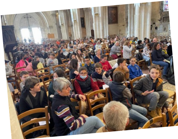
Rassemblement Diocésain 6è/5è à Châteauroux le 30 avril : « Ecoute la terre, prends soin de ton frère »