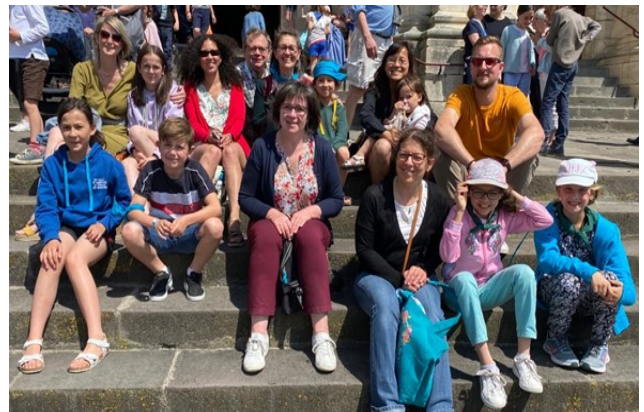
Pèlerinage à Notre Dame des Enfants à Châteauneuf le 8 mai