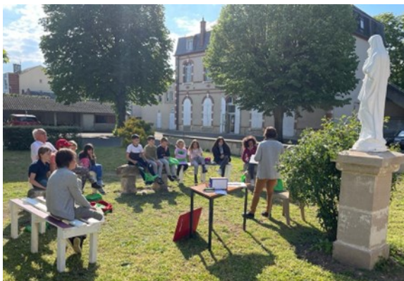
Atelier prière dans le jardin de la Vierge