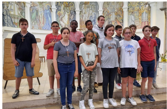
Retraite de profession de foi pour les 5ème des Paroisses St Guil- laume et St Germain, le 21 mai