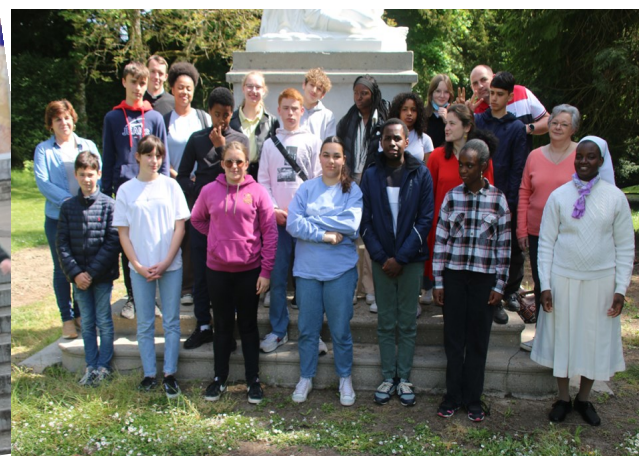
Retraite de Confirmation à Pellevoisin 7 et 8 mai