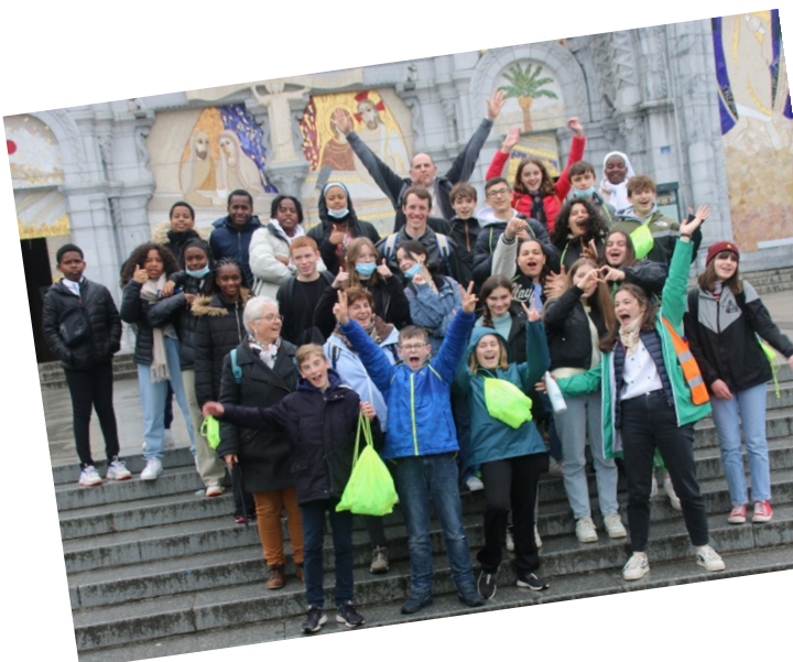
Pèlerinage à Lourdes : « Allez dire aux prêtres ... » du 18 au 22 avril