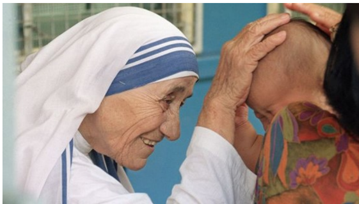
Prière de Mère Térésa

Seigneur, quand je suis affamé, Donne-moi quelqu'un qui ait besoin de nourriture. Quand j'ai soif, envoie-moi quelqu'un qui ait besoin d'eau Quand j'ai froid, envoie-moi quelqu'un à réchauffer. Quand je suis blessé, donne-moi quelqu'un à consoler. Quand ma croix devient lourde, donne-moi la croix d'un autre à partager. Quand je suis pauvre, conduis-moi à quelqu'un dans le besoin. Quand je n'ai pas de temps, donne-moi quelqu'un que je puisse aider un instant. Quand je suis humilié, donne-moi quelqu'un dont j'aurai à faire l'éloge. Quand je suis découragé, envoie-moi quelqu'un à encourager. Quand j'ai besoin de la compréhension des autres, donne-moi quelqu'un qui ait besoin de la mienne. Quand j'ai besoin qu'on prenne soin de moi, envoie-moi quelqu'un dont j'aurai à prendre soin. Quand je ne pense qu'à moi, tourne mes pensées vers autrui.