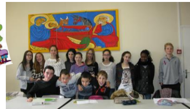
Le groupe Sacré-Cœur Cathédrale