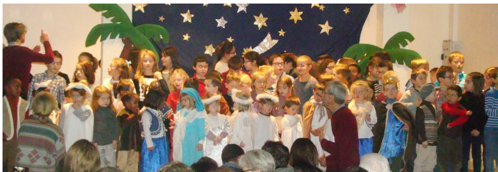
L'équipe éducative Saint Joseph.

Nous vous souhaitons aussi beaucoup de joie.