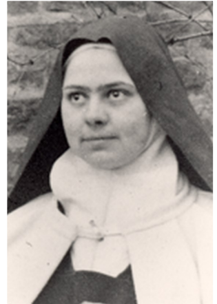
Sœur Élisabeth de la Trinité

Le dimanche 16 octobre, le Pape a canonisé sept nouveaux saints dont deux français: Sœur Élisabeth de la Trinité, carmélite (1880-1906) et le Frère Salomon Leclercq, lasallien (1745-1792), mort martyr le 2 septembre 1792 lors des massacres des Carmes où furent tués trois évêques, 127 prêtres, 56 religieux et 5 laïcs qui ont été béatifiés en 1926. Élisabeth de la Trinité est née le 18 juillet 1880 au camp d'Avord où son père était capitaine. D'un tempérament volontaire, turbulente parfois violente, elle s'efforce de vaincre son caractère par amour de Jésus. Elle veut rentrer au Carmel pour prier sans fin, mais sa mère s'y oppose. Elle entre au Carmel de Dijon à l'âge de 21 ans. En 1906, elle est atteinte de la maladie d'Addison, subit une agonie de neuf mois et meurt le 9 novembre 1906. Ségolène Royal représentait le gouvernement et comme