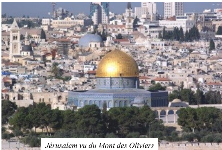
Jérusalem vu du Mont des Oliviers