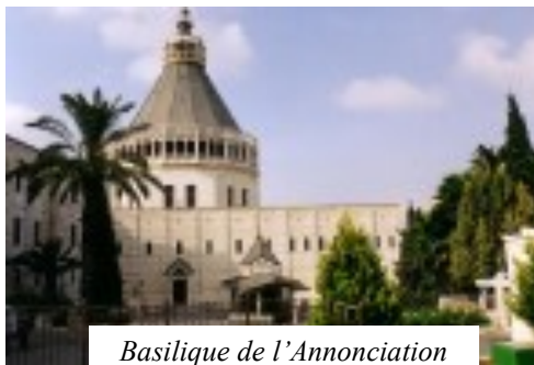
Basilique de l'Annonciation

Le 14 février , après le petit déjeuner, grand départ pour le Mont Thabor avec la messe, suivie de la visite de la Basilique de la Transfiguration . L'après-midi visite du lieu de l'Annonciation . Après le dîner rencontre avec une des sœurs de Nazareth pour la visite des fouilles et du tombeau du Juste . Ce qui nous donne une bonne vision sur l'époque du Christ.