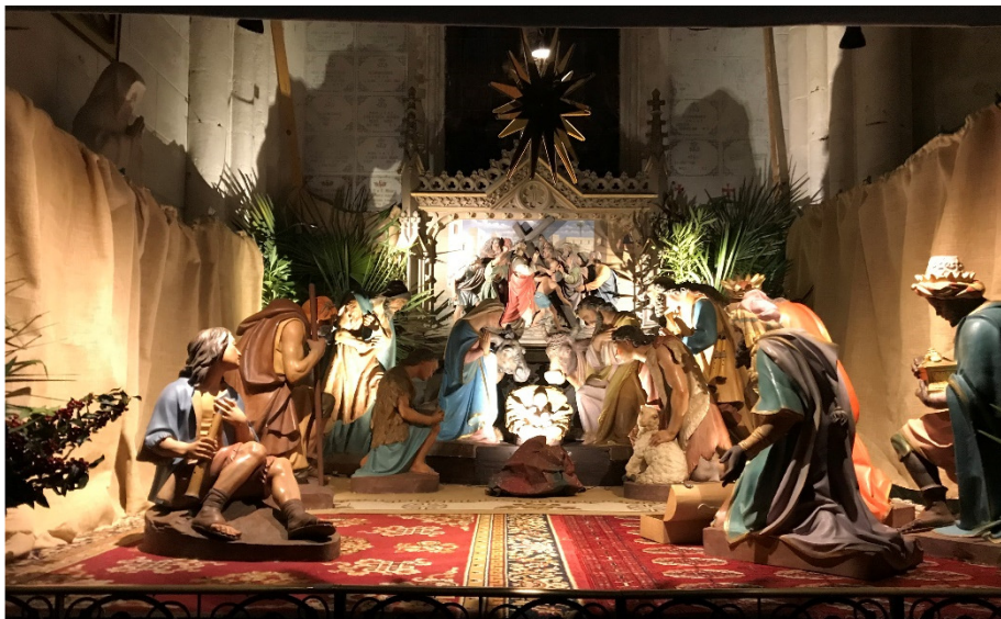
La crèche de la basilique (voyez dans le cahier central)