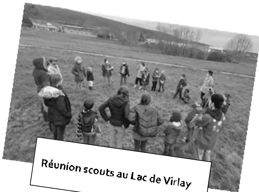
Réunion scouts au Lac de Virlay

contact : sgdf.saintamand@gmail.com - 06 82 83 83 29