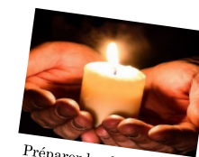
Préparer les funérailles