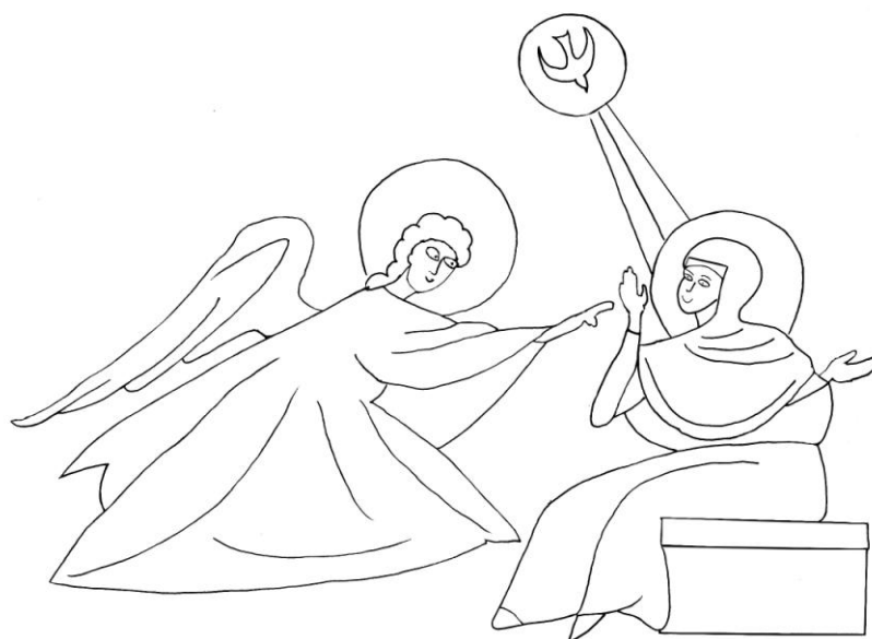
Image pour pot style yaourt à reproduire et découper en suivant les traits

Envoyer des photos de vos réalisations, créations... à parlaparole@gmail.com Merci