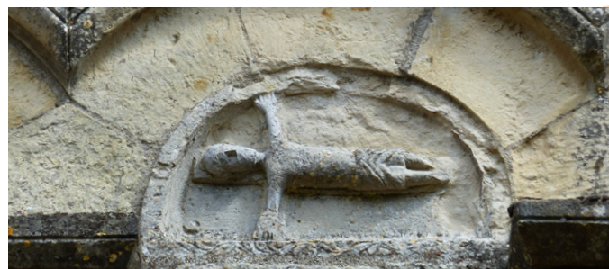
sur la façade de l'église Saint André de Jussy Champagne (18)