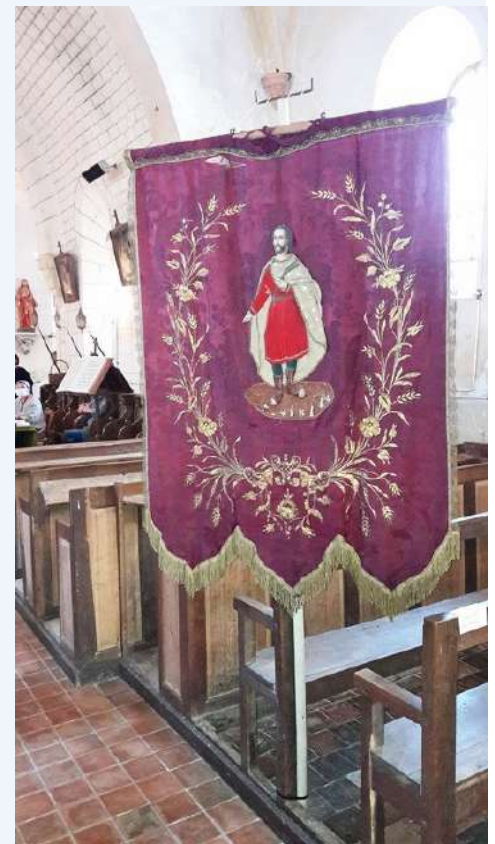
Saint Paul d'Aubinges