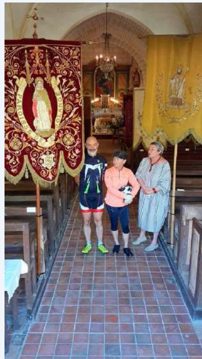
Les journées du patrimoine en cyclotourisme