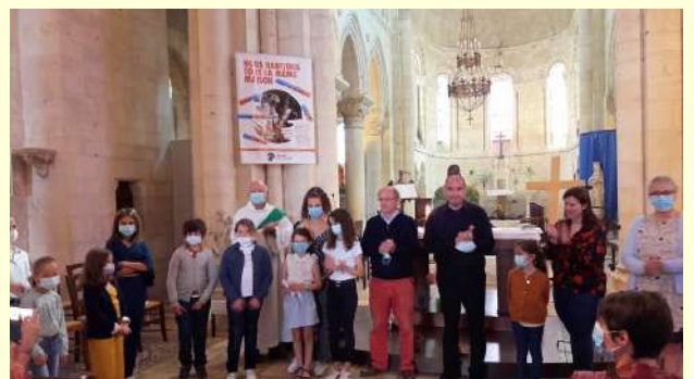
Messe de rentrée aux Aix d'Angillon