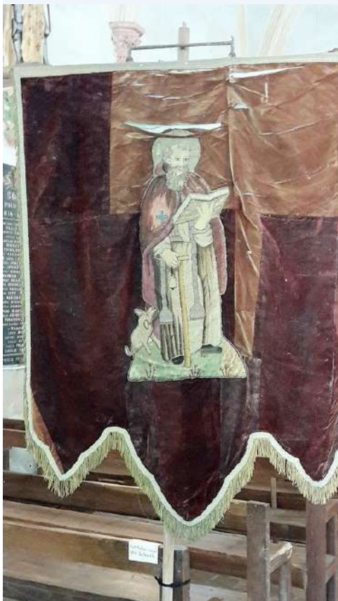
Saint Pausen de la Chapelotte

flottées au travers de nos chemins de campagne lors des processions patronales et autres événements.