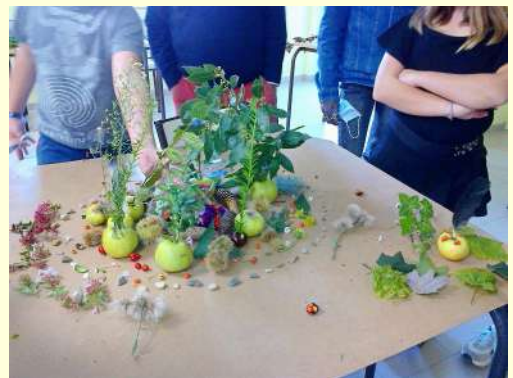
Réalisé par les jeunes de 6 e et 5 e .