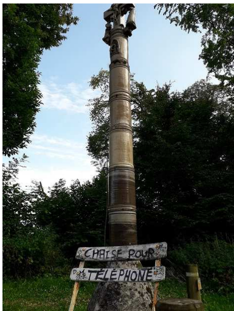
Photo sourire/ Communique avec le ciel