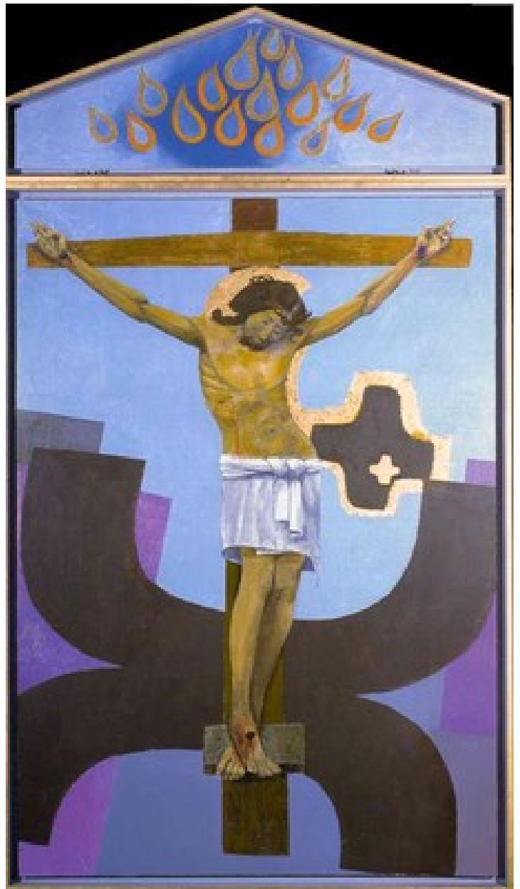
« Crucifixion » du Polyptyque « Passion et résurrection » Arcabas 2003

54 À la vue du tremblement de terre et de ces événements, le centurion et ceux qui, avec lui, gardaient Jésus, furent saisis d'une grande crainte et dirent : « Vraiment, celui-ci était Fils de Dieu ! ».