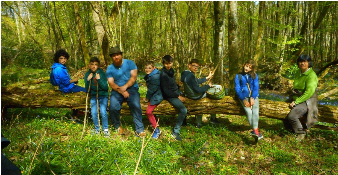
17 avril 2019 Journée nature et Land art.