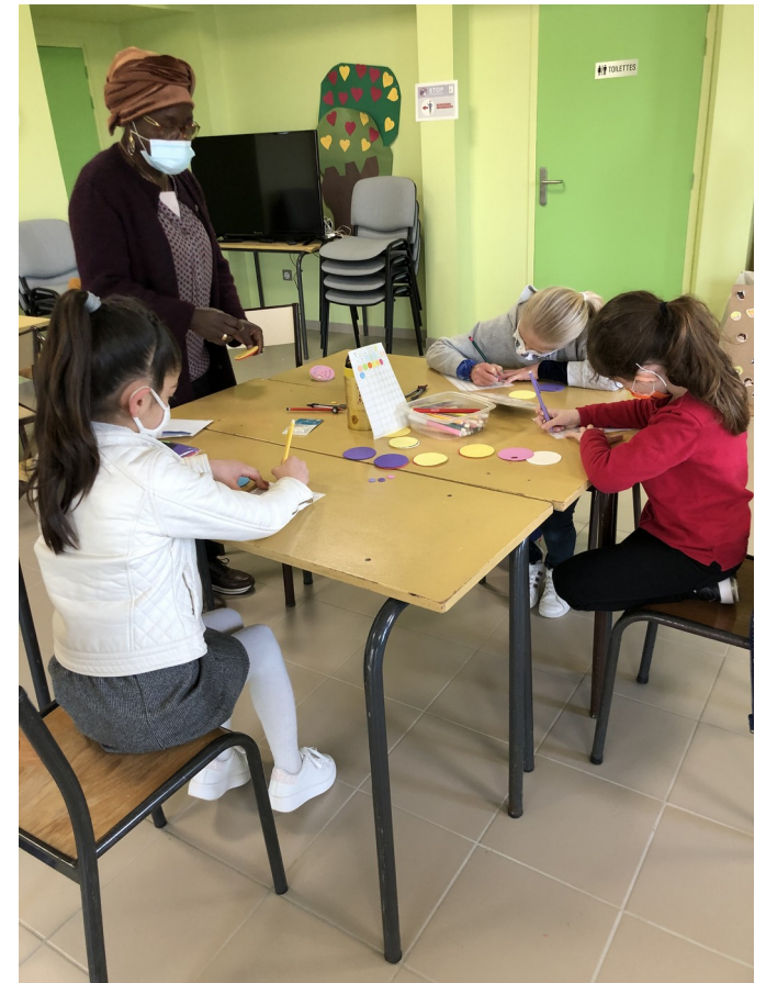
Février 2021 aux Aix d'Angillon