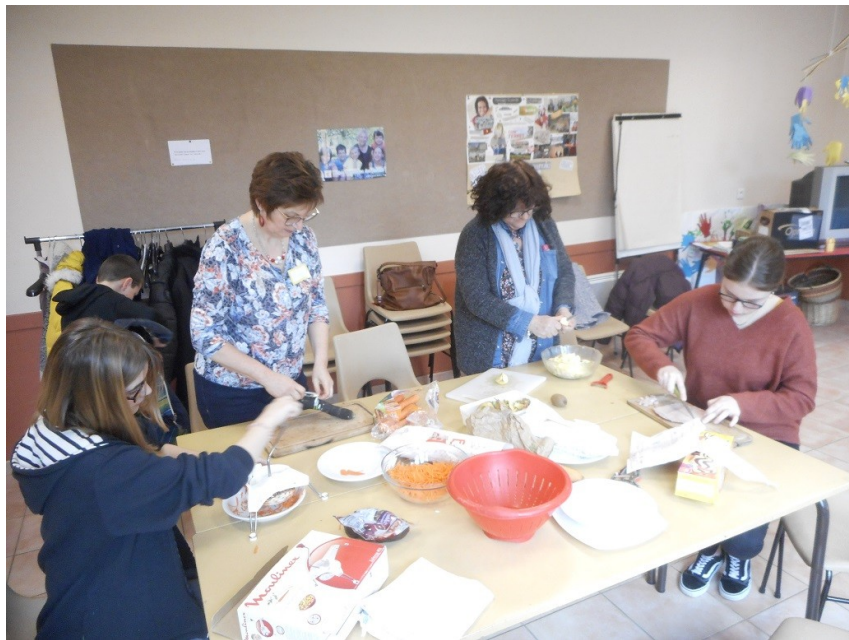
Février 2020 à Henrichemont