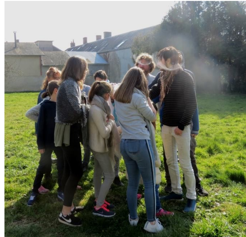
Février 2019. Des jeunes du MRJC sont animateurs.